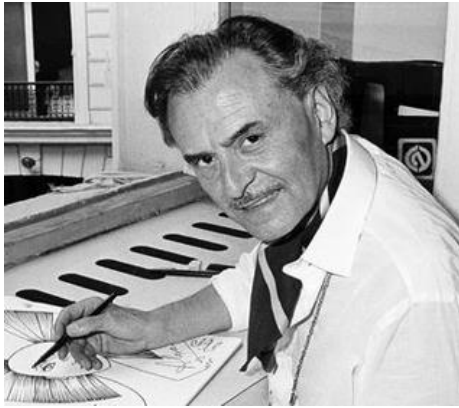
Alexandre de Paris

Célèbre maître coiffeur français, il est surnommé « le coiffeur des reines ». Avec lui, la Haute couture Parisienne et les professionnels de la coiffure ont commencé à travailler ensemble.