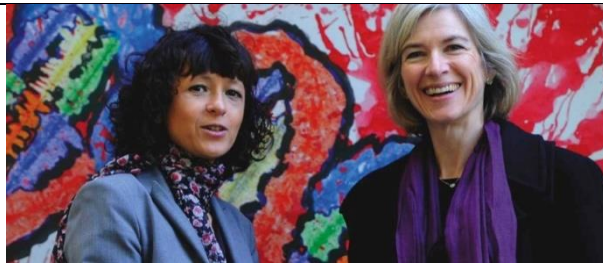
Jennifer Doudna et Emmanuelle Charpentier

Ancienne championne olympique de tir, aux JO d'été de 1992, elle remporte la médaille d'or en épreuve mixte, épreuve supprimée par la suite.