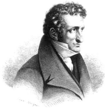
Le docteur Itard

Grand pédagogue, il est persuadé que tout le monde est éduicable. Il est connu pour avoir révélé l'intelligence de Victor, un enfant dit « sauvage » car retrouvé abandonné dans les forêts de l'Aveyron.